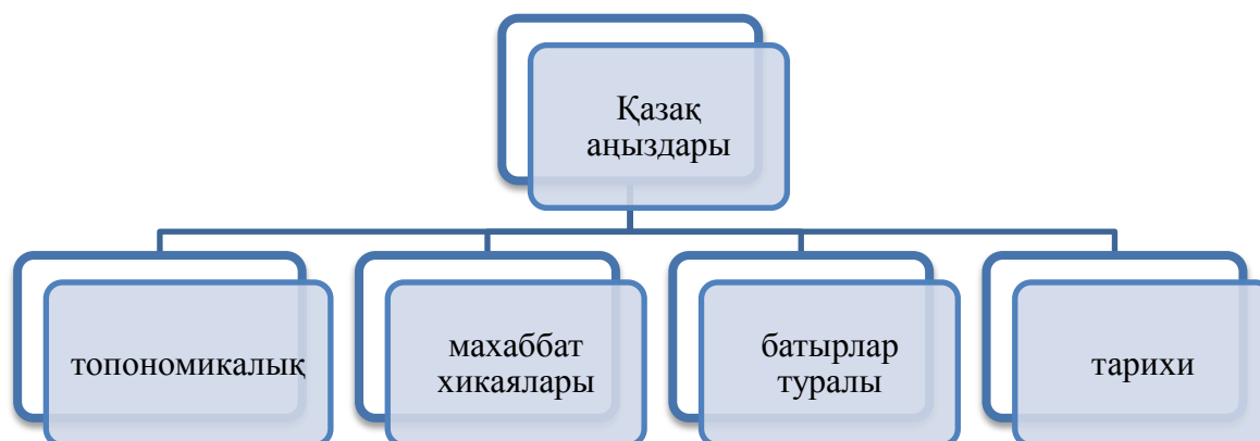
Кесте 16. Қазақ аңыздарының жіктемесі

Топонимикалық аңыздар – жер-су, өзен көл атауларына, олардың аттарының қалыптасуына немесе шығу тарихына бағытталуы мүмкін. Мысалы: «Бурабай», «Баянауыл», «Қарағанды», «Жекебатыр», «Шайтанкөл», «Екібастұз», т.с.с.